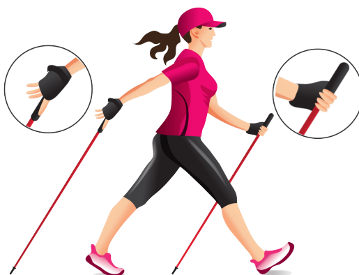
tecnica corretta di nordic walking

La spinta sul bastoncino deve essere evidente ed attiva: in fase di appoggio il braccio deve estendersi ed esercitare una spinta graduale che termini visibilmente oltre l'anca. La mano che impugna il bastoncino deve esercitare la spinta durante la fase di conduzione. La spinta va mantenuta anche oltre il superamento dell'anca e nella fase di apertura della mano generando uno spazio vuoto (luce) tra la mano ed il bacino. In fase di appoggio iniziale del bastoncino e al termine della spinta, gambe e braccia dell'atleta possono risultare leggermente flesse in modo naturale.